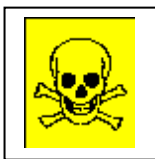
T + sehr giftig

Pflanzenschutzmittel sind mit folgenden Gefahrensymbolen und Gefahrenbezeichnungen gekennzeichnet (schwarzer Aufdruck auf orangegelbem Grund). Die für das jeweilige Präparat erforderlichen Schutzmaßnahmen sind der Gebrauchsanleitung zu entnehmen. Allgemeine Vorsichtsmaßnahmen beim Umgang mit Pflanzenschutzmitteln sind zu beachten.